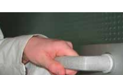
Die Türklinkenüberzieher Clean Hands

Um die Studie durchzuführen, wurde Station 7 ausgewählt. In Station 7a werden alle Türklinken 30 Tage lang mit den Überziehern versehen. Im selben Zeitraum werden dagegen die Kliniken in