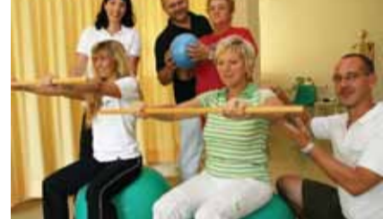
Reha-Kurse im Prosper-Hospital

Wöchentlich finden in der Physiotherapie des Prosper-Hospitals 16 Kurse statt. Termine gibt es sowohl vormittags als